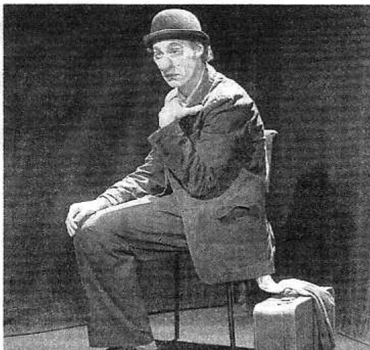
« Petit boulot pour vieux clown » est une pièce contemporaine, mêlant humour et dérision, théâtre burlesque et théâtre de l'absurde.

C'est une pièce difficile à interpréter car le texte est long et les didascalies sont réputées comme étant impossibles à représenter sur scène. Je l'avais vue la première fois il y a une dizaine d'années à Avignon. Et j'avais beaucoup aimé. Il se trouve que les comédiens avec qui je travaille avaient le même sentiment. Nous l'avons présentée la première fois au festival d'Avignon en 2004. Je crois qu'elle a été remarquée car il n'y a pas de men-