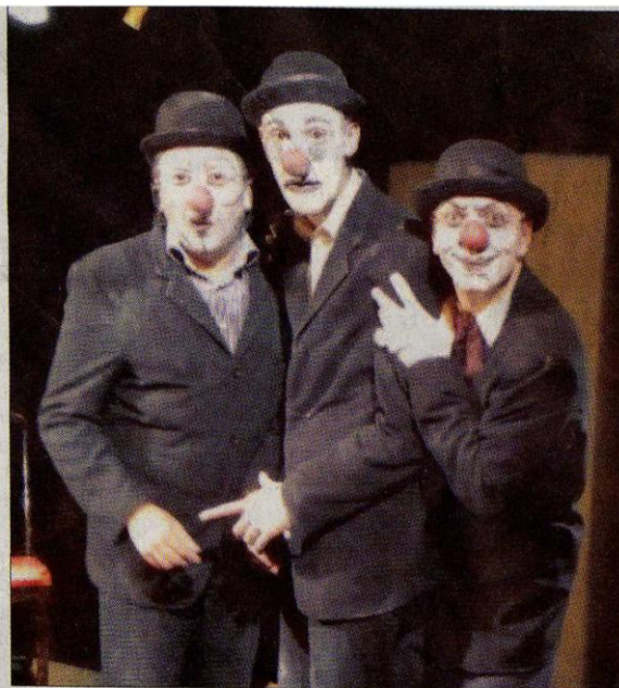
Chartres, dimanche. La pièce de Matéi Visniec est une formidable leçon de vie.

Petit boulot pour vieux clown : représentations les jeudis, vendredis et samedis à 21 heures. Le dimanche à 16 heures. Réservations au 02.37.36.33.06. ou sur www.theatreportailsud.com . Tarif général : 15 €, réduit : 11 €.